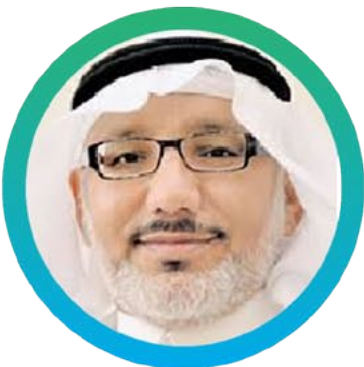
٩) أ.د. خالد بن أحمد البوسعيد جامعة الملك فيصل