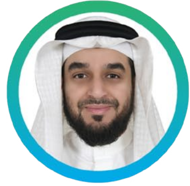
١) أ.د. عبدالمنعم بن عبدالسلام الحياتي جامعة الملك عبدالعزيز