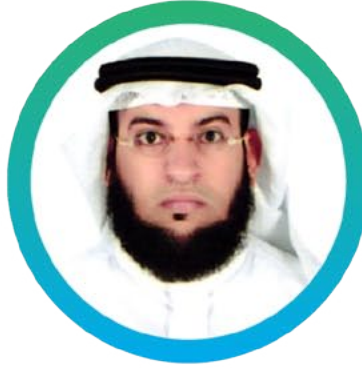
٣٨) د. عائض بن مبارك الحربي جامعة تبوك