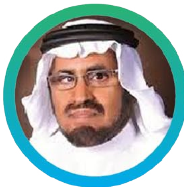
٨) أ.د. علي بن سليمان التواجري جامعة الملك سعود بن عبدالعزيز الصحبة