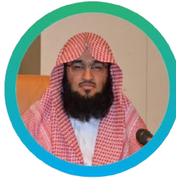
٣٢) د. عبدالعزيز بن عبدالرحمن الغايز الجامعة السعودية الالكترونية